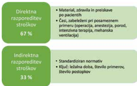
Slika 2. Način razporeditve stroškov bolnišnic na posamezno obravnavo.

Sodelavci projekta SPP smo v sodelovanju z zunanjim strokovnjakom v letu 2024 razvili metodologijo za izračun stroškov posameznih obravnav in s tem uteži SPP. Pri tem smo sledili ustaljenim praksam, ki se uporabljajo v drugih državah (Nemčija, Avstralija, skandinavske države). Zadovoljni smo, da je bilo 67 % bolnišničnih stroškov razporejenih na posamezne obravnave neposredno, saj so nam bolnišnice podatele o materialnih stroških in o aktivnostih, na podlagi katerih smo razporedili stroške plač, posredovali za vsako obravnavo posebej. Najbolj napredne države, ki redno izvajajo in dopolnjujejo svoje stroškovne analize, na tak način razporedijo okrog 80 % stroškov. Za primerjavo: v nacionalni stroškovni analizi v letu 2019 je bilo neposredno razporejenih le 55 % stroškov.