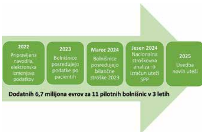
Slika 1. Časovnica nacionalne stroškovne analize.

Glede na ugotovitve iz kontrol podatkov bodo morale bolnišnice v prihodnje izboljšati poročanje o stroških za porabljena (predvsem draga) zdravila in materiale, v poročanje dosledneje vključevati tudi ostale stroške (npr. storitev zunanjih izvajalcev), izboljšati popolnost poročanja kategorizacij nege in trajanja operacij ter vzpostaviti boljše evidence za razmejevanje stroškov med posameznimi delovišči (oddelek, intenzivna enota, operacijska dvorana itd.). Poseben izziv pa predstavlja tudi kodiranje, saj imata tako pretirano kot nepopolno kodiranje bolnišničnih obravnav neposreden vpliv na končno višino uteži in s tem na ceno bolnišnične obravnave.