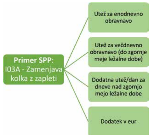
Slika 3. Po novem bo imel vsak SPP več uteži.

mulacije novih uteži za vse izvajalce v sistemu SPP. Do konca leta bomo izračune predstavili vsem deležnikom v sistemu ter pripravili podlage za uvedbo uteži v letu 2025.