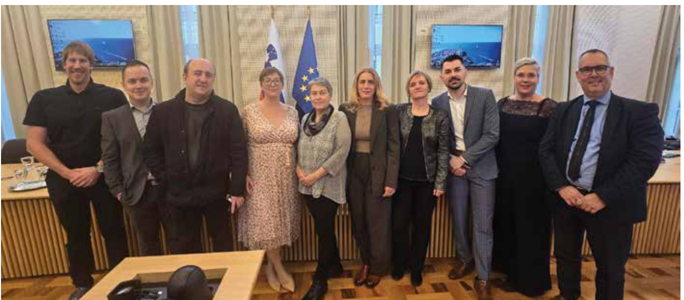
Slika. Podpisniki aneksov h KP in Dogovora v okviru stebra zdravstva, socialnega varstva in obvezne socialne varnosti.

Celoten članek z vsemi podrobnostmi lahko preberete na spletu.