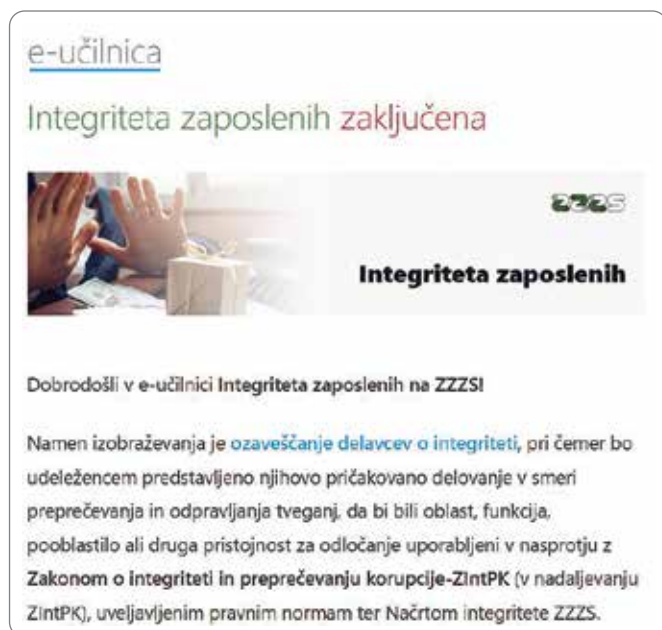
Slika 1. eUčenje »Integriteta« – vstopna točka.

Opozorili bi na izogibanje uporabe virov Zavoda za lastne namene , kamor sodijo prostori, sredstva (informacijska tehnologija in drugo) ter delovni čas , ko smo evidentirali prisotnost na delu. Sektor za razvoj kadrov in organizacije pripravlja interni akt na podlagi ukrepa iz načrta integritete, kar je zahtevala tudi Komisija za preprečevanje korupcije.