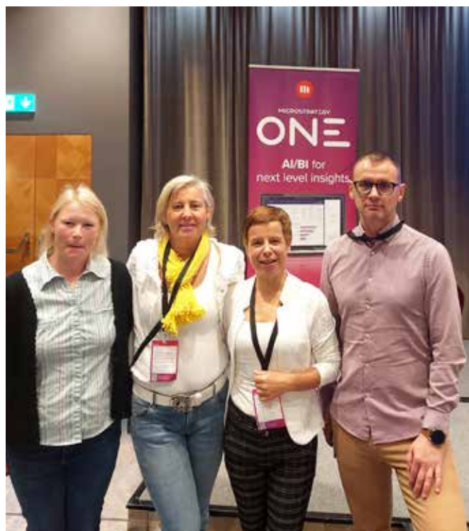
Slika 2. Udeleženci ZZS na konferenci