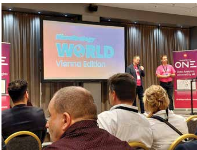
Slika 1. Odprtje konference

V zanimivi panelni razpravi so predstavniki PwC Avstrija, ONTEC AG in Google Cloud delili svoja mnenja o prednostih in izzivih uporabe AI in BI v Avstriji in vzhodni Evropi. Strokovnjaki so poudarili, kako AI že izboljšuje učinkovitost poslovanja, ter razpravljali o izzivih, kot sta zasebnost podatkov in integracija tehnologij. Večina predavateljev je menila, da organizacije danes niso pripravljene na AI, ker ne razumejo njenega delovanja. Poudarjeno je bilo, da AI ni kristalna krogla ali nekaj magičnega , ampak zgolj dodatno orodje za pomoč na poti do končnega cilja. Tudi AI dela napake in se uči , zato je potrebno preverjanje rezultatov in popraviljanje, kot pri vseh ostalih orodjih. Ima pa veliko prednost – je bistveno hitrejša .